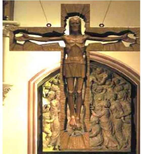
Dieses Kruzifix wird „Auferstehungskruzifix“ genannt. Es soll der Eindruck erweckt werden, daß Jesus in einer Schachtel eingeschlossen und somit nicht von den Toten auferstanden ist