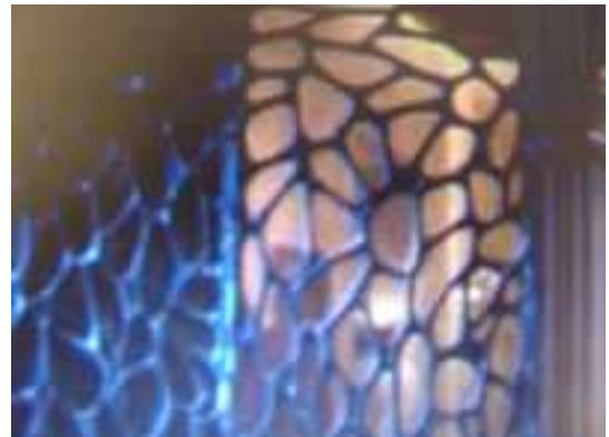
Spinnennetze verhüllen auch den hinteren Eingang der Kathedrale.