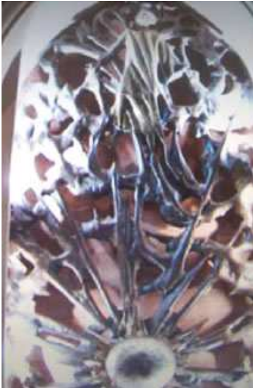
Links: Der Tabernakel als Ei in einem Spinnennetz. Wir sehen auch den Heiland oder einen Heiligen im selben Netz gefangen, besonders deutlich bei den Händen.