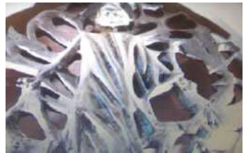
Teile des Netzes sind Teil der Bekleidung der Gottesmutter. Die Gottesmutter wird gezeigt als Gefangene in einem satanischen Netz.