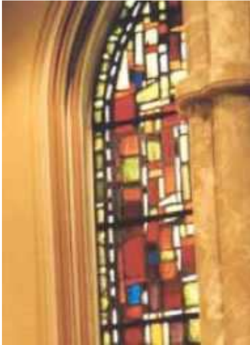
Die Heiligenbildern, die einst die Fenster zierten, wurden durch Ansammlungen von bunten Feldern ersetzt, die nichts als Leere repräsentieren.

Die Kathedrale zum Heiligen Namen wurde vor einigen Jahren „renoviert“. Die Veränderungen und Hinzufügungen waren satanistisch. Bernardin dürfte sich in der Hauptkirche der Erzdiözese von Chicago sehr heimisch gefühlt haben.